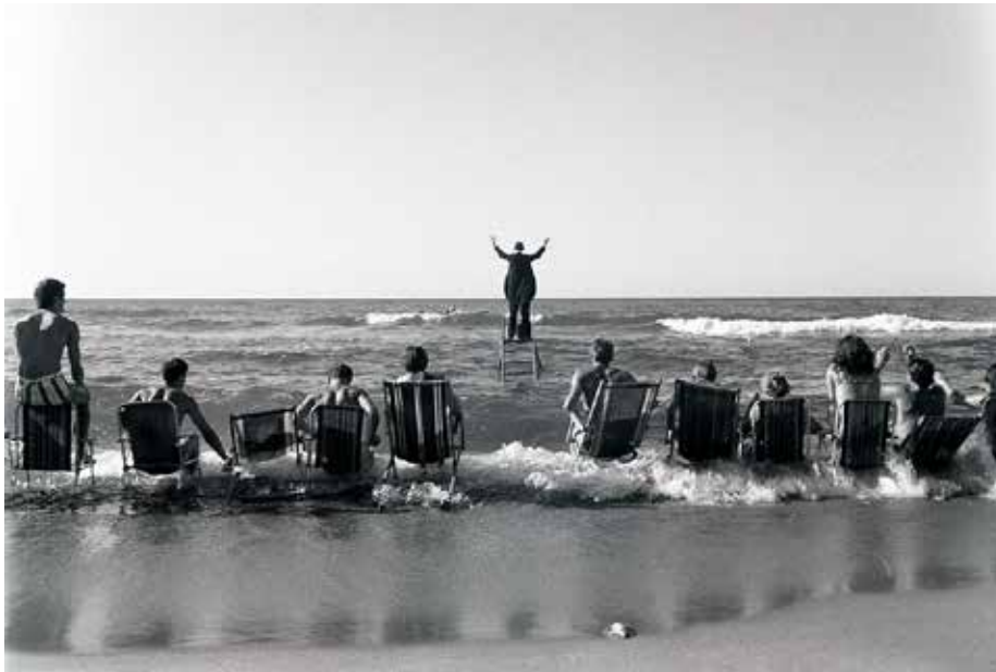
«Panoramic Sea Happening», Tadeusz Kantor, Łazy, 1987

“El mar como simbolo tanto de la continuidad como de la discontinuidad del sonido.” 1