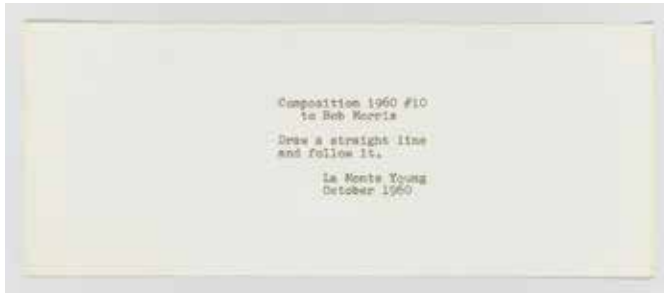
«Composition 1960 #10», La Monte Young