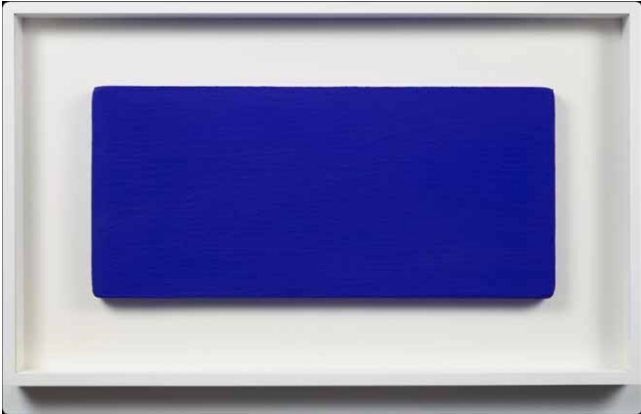
Yves Klein, «Untitled Blue Monochrome (IKB 231)», 1959